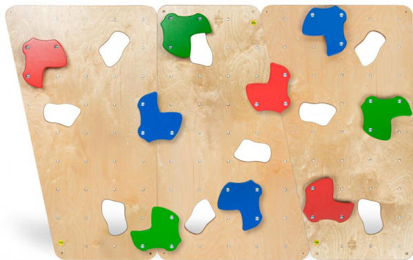
Erzi Kletterwand Junior ER44016