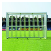
Bolzplatztor 5x2 m, mit Alu-Ballfang, freistehend ohne Basketball-Aufsatz