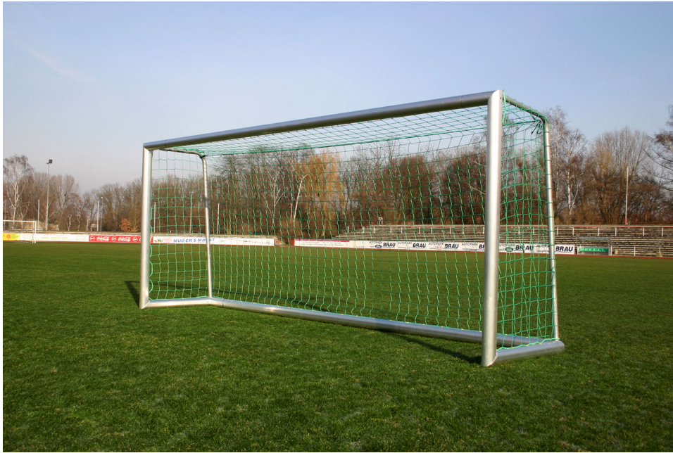
HELO Sports Jugendtor B00213