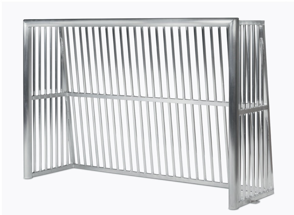
Haspo Bolzplatztor 1061