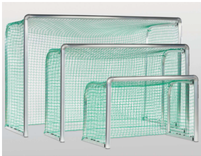
HaspoHaspo Minitor klappbar 152, 1521, 1523