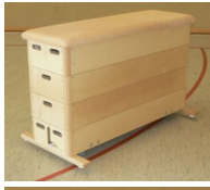
Roweco Sprungkasten 5-teilig multiplex-KU-n