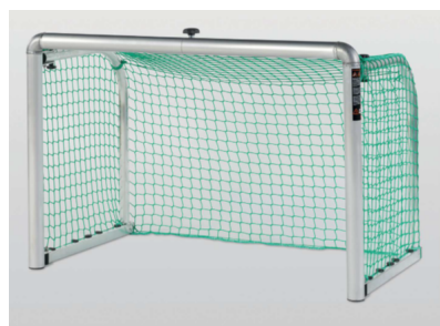
Haspo Minitor klappbar 152945