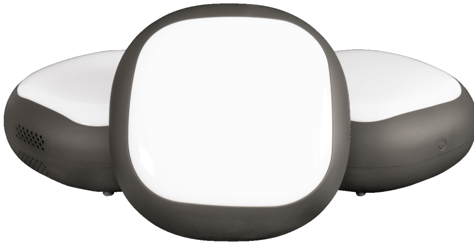
Champs ROXPro - 3pcs