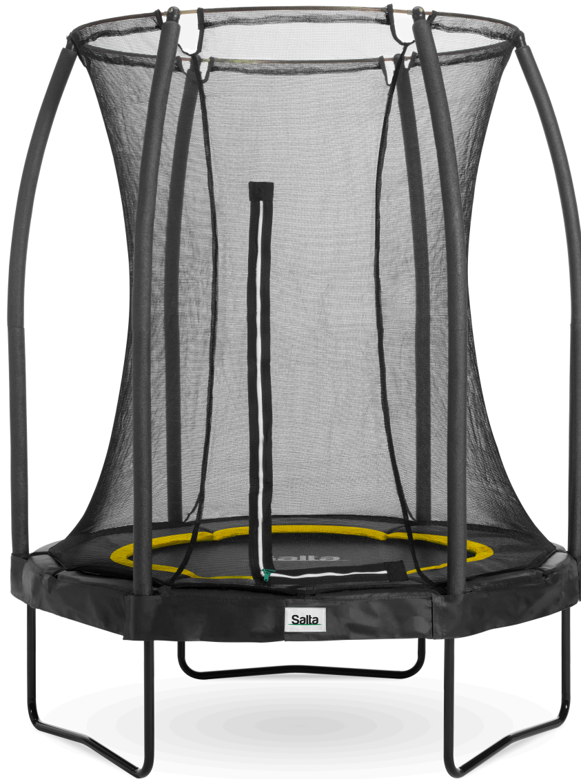
Salta Trampolin 5070A-schwarzV1