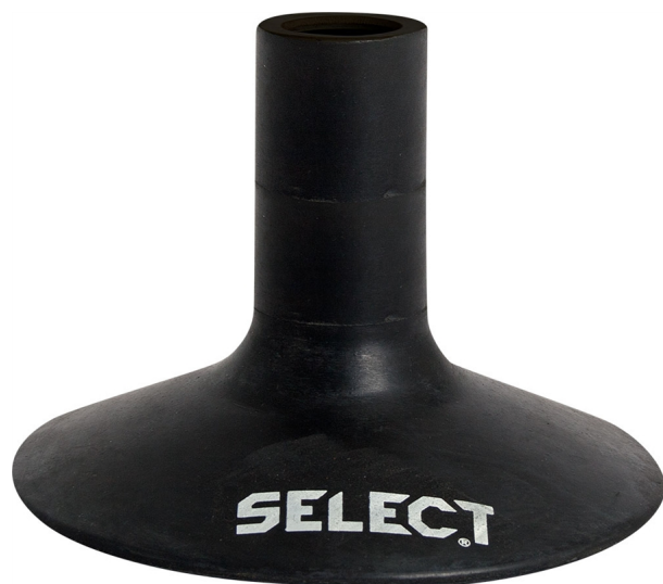
Standfuß für Slalomstange 7481000000