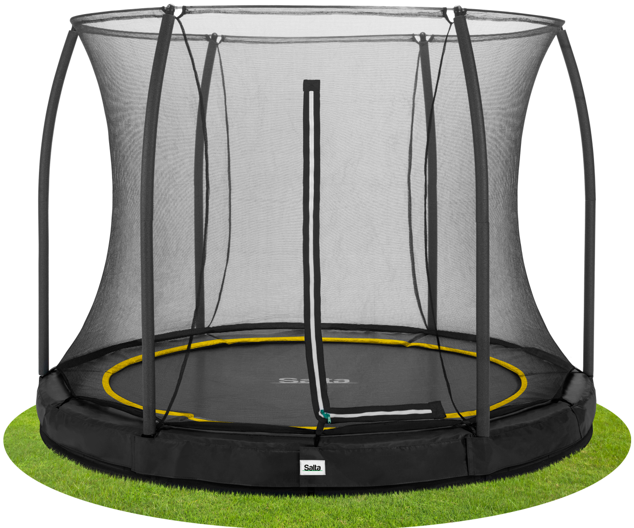
Salta Trampolin Comfort Edition Ground 5391A