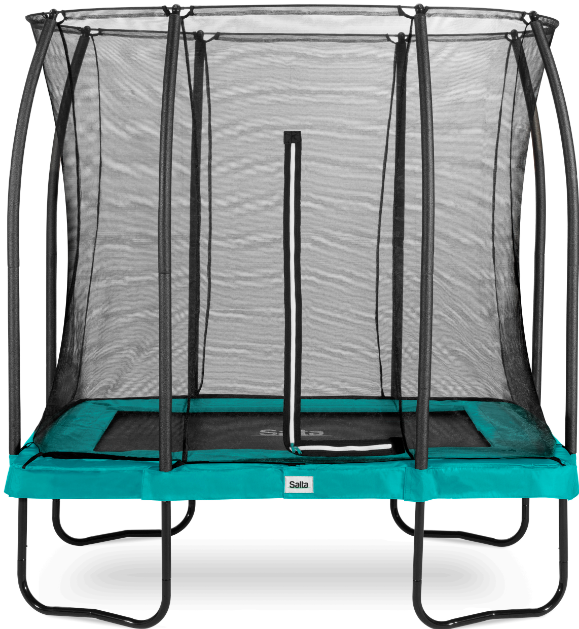
Salta Comfort Edition 5091G