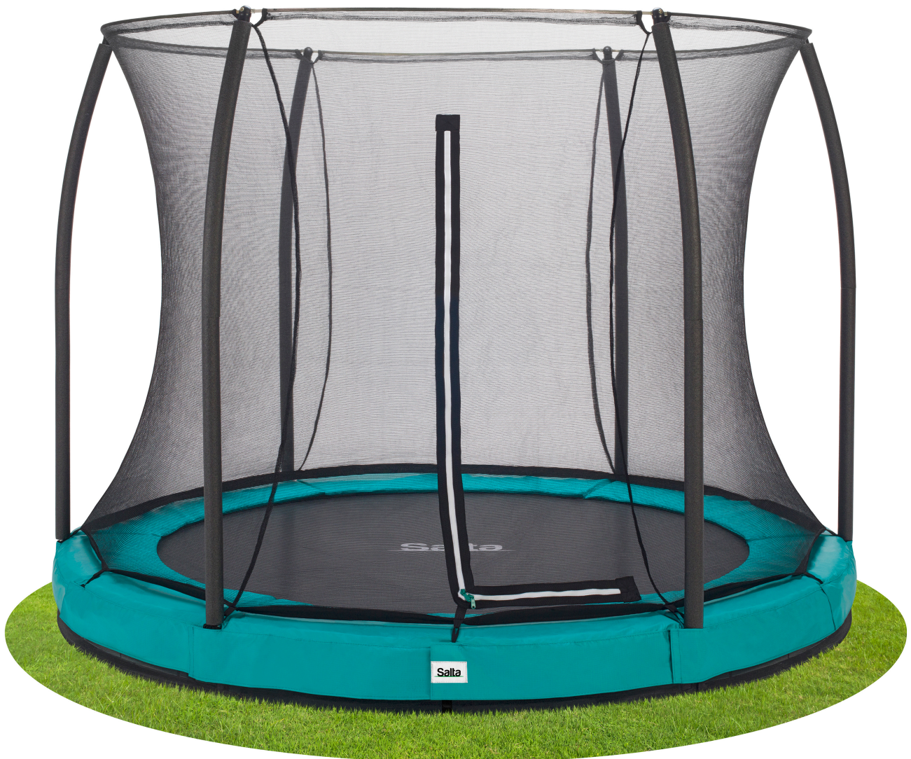
Salta Comfort Edition Ground 5391P