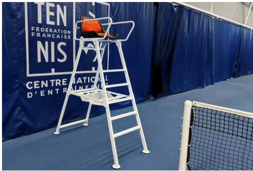
Schiedsrichterstuhl "Aluminium " zusammenklappbar - Turnier