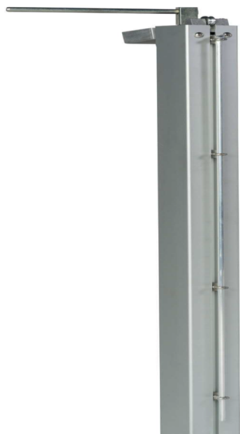
Haspo Tennisposten 500