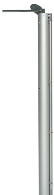
Haspo Tennisposten 502