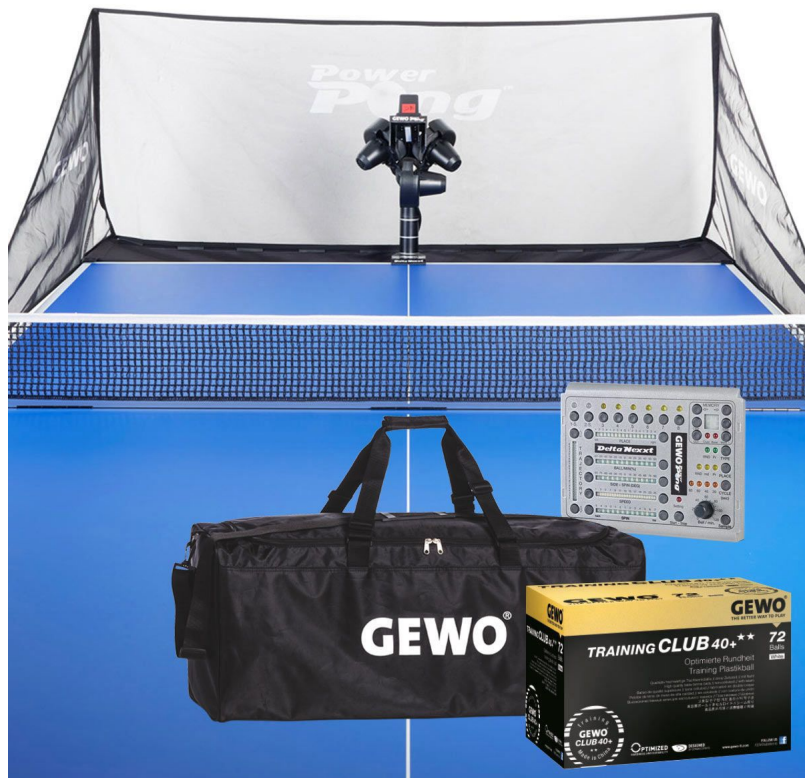
TT-GEWO ROBOTER SET DELTA