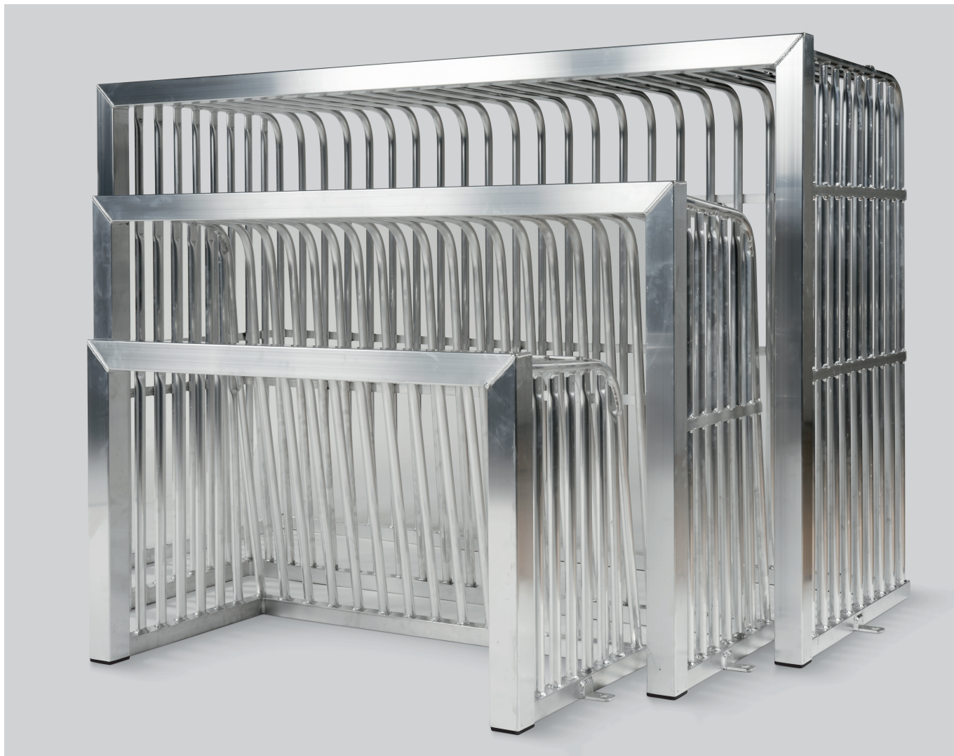
Haspo Mini-Bolzplatztor 162, 1621, 1623