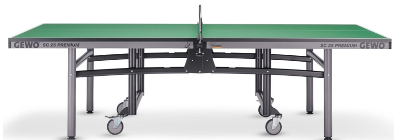
GEWO SC 25 Premium grün